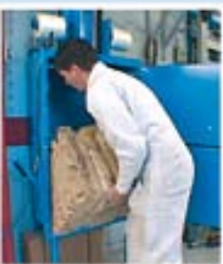
Makkelijk te ledigen!