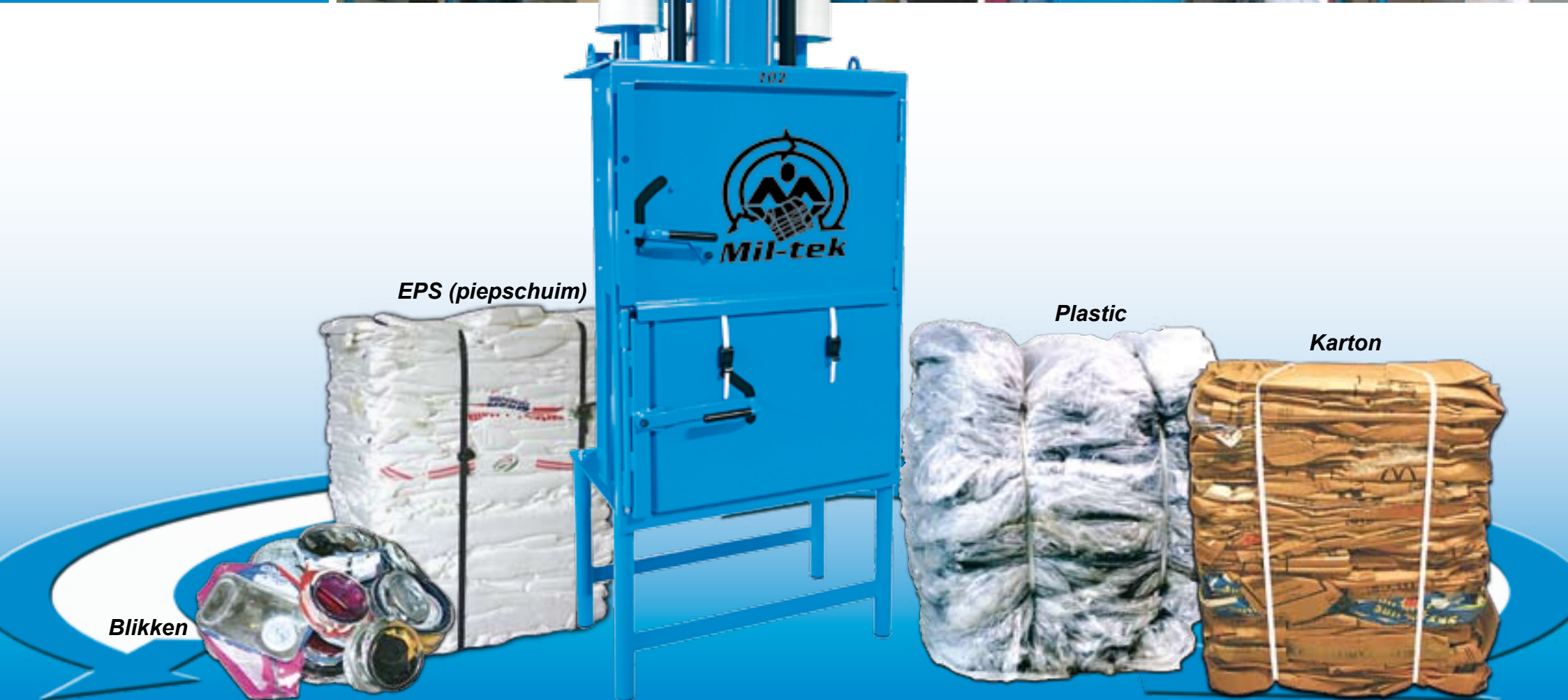
Model 102 - Combi balenpers