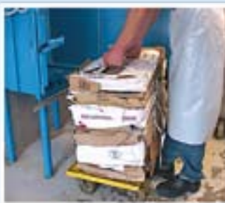
Makkelijk te hanteren balen!